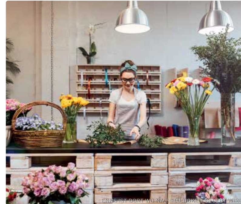
ENNS IST DORT WO NACHHALTIGKEIT GELIEBT WIRD

Bei den persönlichen Beratungsgesprächen werden Sie erfahren, dass bei Einkäufen in der Innenstadt immer der Mensch im Vordergrund steht und bei einer Tasse Kaffee oder einem Gläschen Sekt vor allem der Faktor Zeit völlig in Vergessenheit gerät. Sie werden vielleicht das Gefühl haben schon einmal hier gewesen zu sein, da Sie auf Ihrem Weg durch die Ennser Geschäfte stets etwas Vertrautes begleiten wird. Seien Sie gespannt; und seien Sie vor allem neugierig.