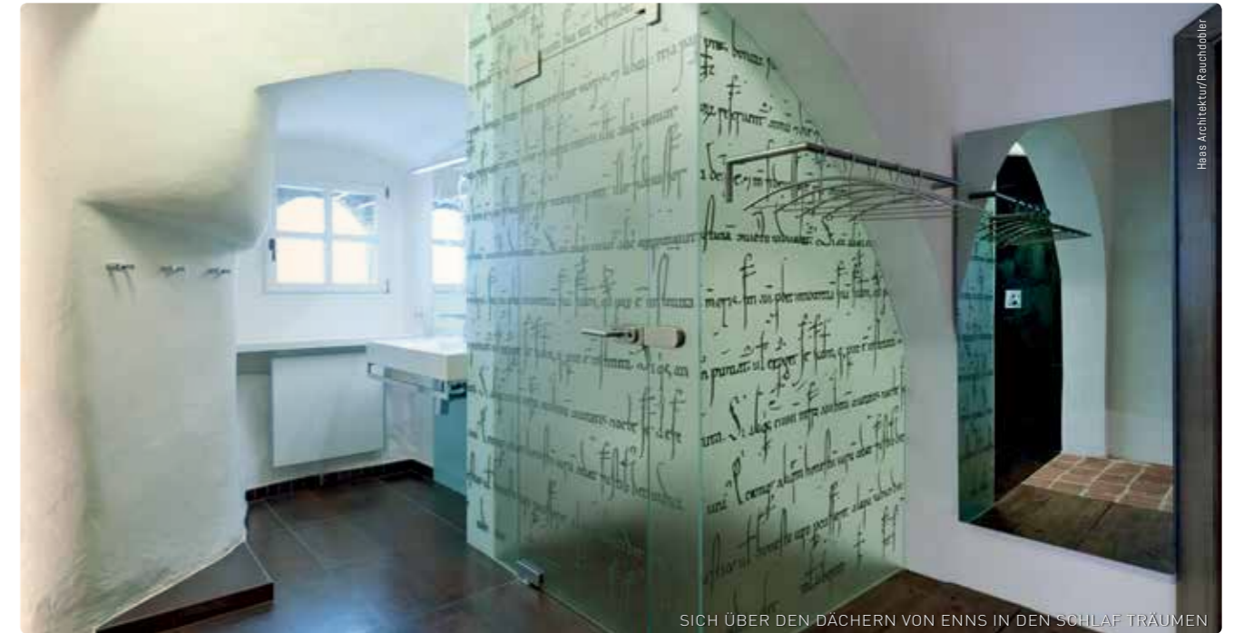
SICH ÜBER DEN DÄCHERN VON ENNS IN DEN SCHLAF TRÄUMEN

Die größte bekannte römische Kalkbrennofen-Anlage des „Imperium Romanum“ ist einen Besuch wert.