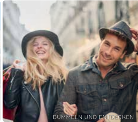
BUMMELN UND ENTDECKEN