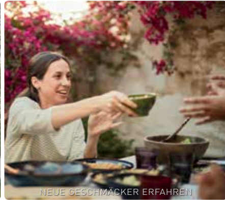
NEUE GESCHMÄCKER ERFAHREN