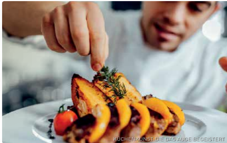
KÜCHENKUNST DIE DAS AUGE BEGEISTERT