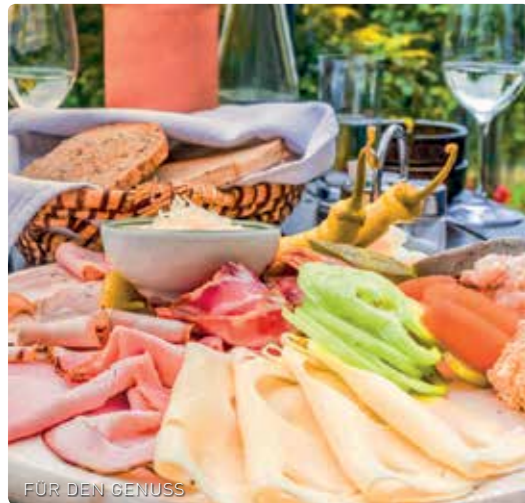
FÜR DEN GENUSS

Was wäre das Leben ohne Genuss, ohne kulinarische Vielfalt und ohne die Möglichkeiten, sich gerade im Urlaub ausgiebig verwöhnen zu lassen? Eine Frage, die man sich in Enns nicht stellen muss, da gerade in Sachen kulinarischem Einfallreichtum, keine Wünsche offenbleiben.