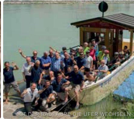
MIT DER RADFAHRE DIE UFER WECHSELN