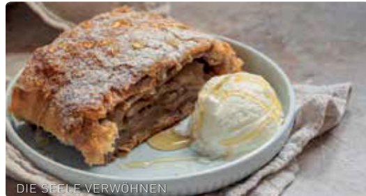
DIE SEELE VERWÖHNEN

Die kulinarische Reise durch Enns führt Sie vorbei an gschmackigen Wirtshausdelikatessen, gut bürgerlichen Küchen, feinen italienischen Speisen, traditionellen Wirtshäusern, kreativen Kreationen, modernen Stadtheurigenambiente, Jausenstationen und herrlichen Weinkarten. Lassen Sie sich von den Variationen unserer Wirte verzaubern und kommen Sie in den Genuss der Region, die in den verschiedenen Gerichten verarbeitet wird.