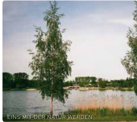
EINS MIT DER NATUR WERDEN