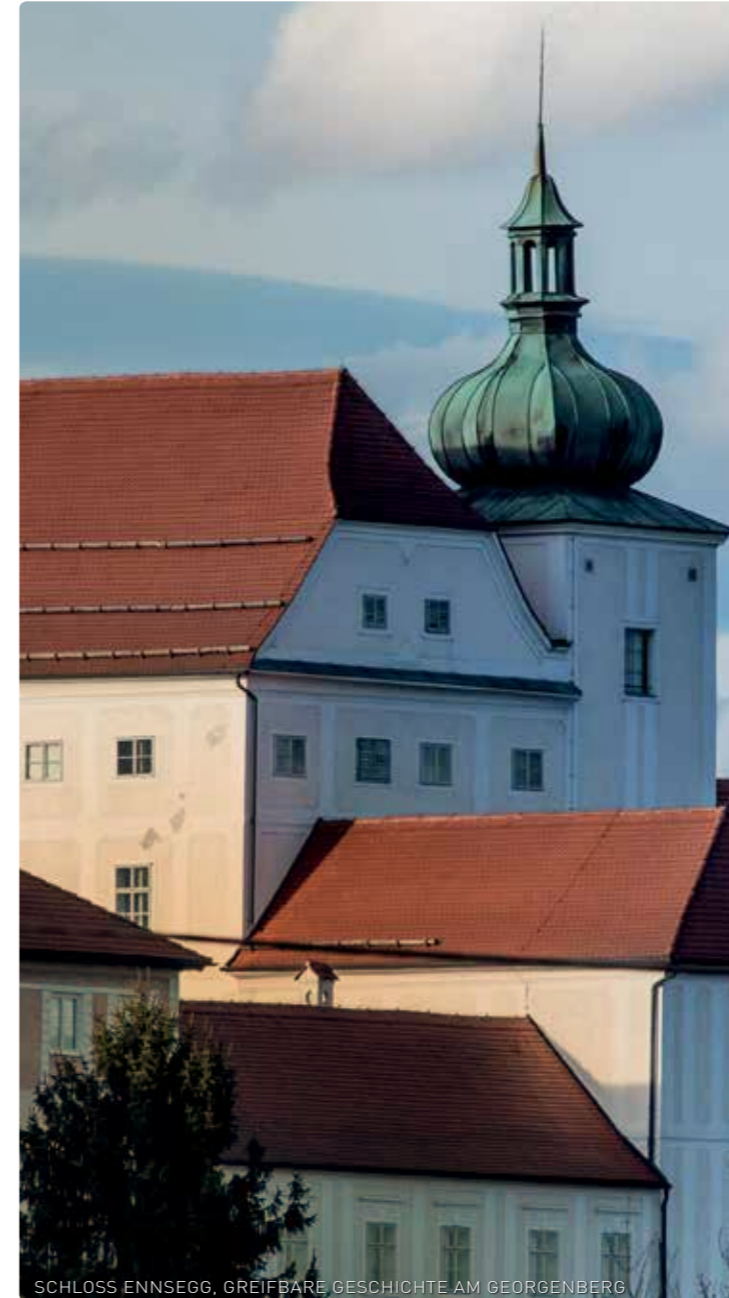
SCHLOSS ENNSEGG, GREIFBARE GESCHICHTE AM GEORGENBERG