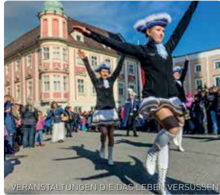
VERANSTALTUNGEN DIE DAS LEBEN VERSÜSSEN