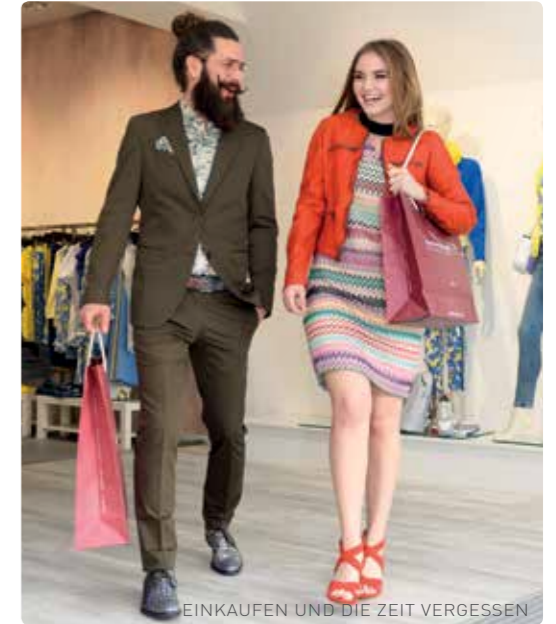
EINKAUFEN UND DIE ZEIT VERGESSEN

Fernab großer Einkaufshäuser werden Sie von den Ennser Geschäftstreibenden wertschätzend in Empfang genommen und durch die einzigartigen Räumlichkeiten geführt, die mit viel Liebe zum Detail einen besonders charmanten Eindruck hinterlassen.